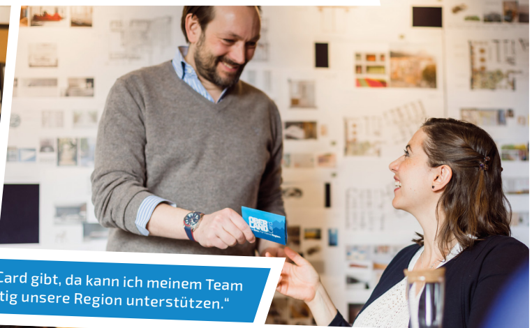
„Super, dass es die OBERLANDCard gibt, da kann ich meinem Team etwas Gutes tun und gleichzeitig unsere Region unterstützen.“