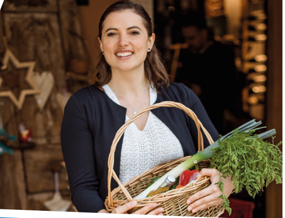
„Mit der OBERLANDCard bezahlen und Punkte sammeln ging total leicht. Jetzt freue ich mich auf ein leckeres Abendessen, zusammen mit meinem Schatzi.“