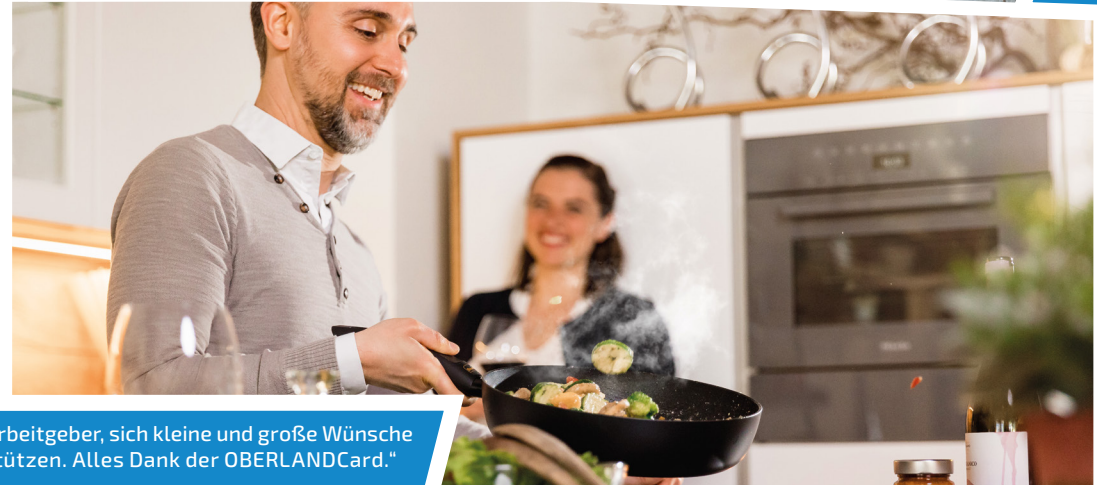
„Alles passt perfekt zusammen. Wertschätzung vom Arbeitgeber, sich kleine und große Wünsche erfüllen und gleichzeitig regionale Geschäfte unterstützen. Alles Dank der OBERLANDCard.“