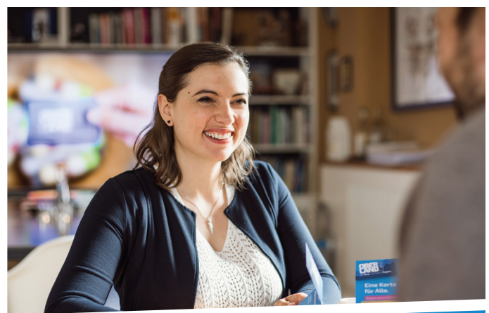
„WOW. Was für eine tolle Überraschung. Ich habe den besten Chef der Welt! Gleich heute werde ich mir regionale Köstlichkeiten für einen besonderen Abend besorgen.“